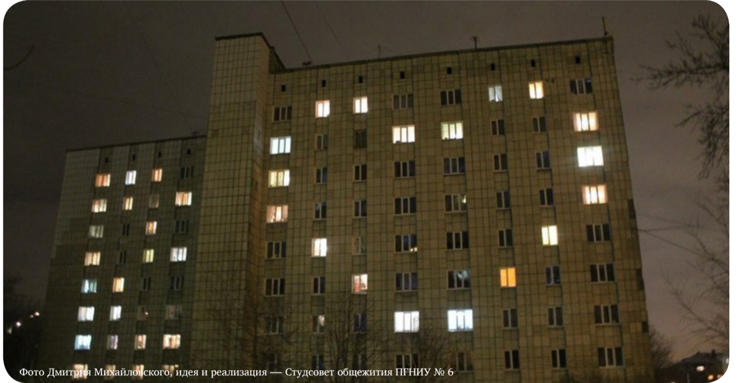
Фото Дмитрия Михайловского, идея и реализация — Студсовет общежития ПГНИУ № 6

В Пермском университете состоялась Всероссийская конференция «Локальный дискурс и конструирование образа территории», организатором которой выступил Российский гуманитарный научный фонд и кафедра журналистики и массовых коммуникаций ПГНИУ. В рамках конференции участники из Иркутска, Москвы, Великого Новгорода, Екатеринбурга, Ижевска и Перми говорили об исторических корнях и конфликтных дискурсах в регионах, спорили о культурной политике городов. В некоторых докладах звучала и тема брендинга университета.