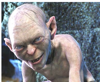
ДИССОЦИАТИВНОЕ РАССТРОЙСТВО ИДЕНТИЧНОСТИ

стелина Колец из ненормального превращается в индивидуума с диссоциативным расстройством идентичности.