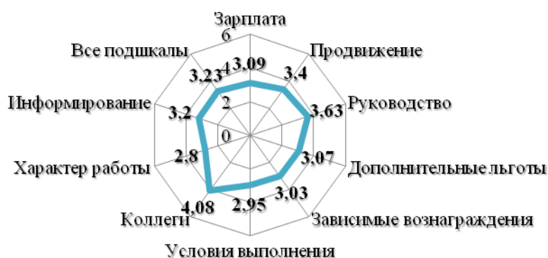
Рис. 1. Показатели удовлетворенности трудом педагогических работников («Опросник удовлетворенности работой»)

В рамках первого опросника исследование проводилось по 9 аспектам работы: зарплата, продвижение, руководство, дополнительные льготы и выплаты, зависимые вознаграждения, условия выполнения работы, коллеги, характер работы и информирование. Респондентам было задано 36 вопросов, раскрывающих вышеперечисленные критерии. Ответы разбивались на шестибалльную оценочную шкалу: 1 – совершенно не согласен, 6 – совершенно согласен. На рисунке 1 представлены результаты, полученные по опроснику Спектора.