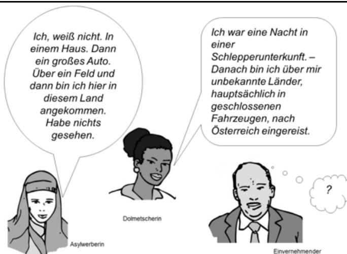
Рис. 2. Иллюстрация к диалогу из Руководства по тренингу устных переводчиков в ходе процедуры получения статуса беженца

После инсценировки начинается дискуссия с обсуждением следующих проблем: 1) Сделала ли переводчица полный перевод сказанного или часть информации была утеряна? 2) Был ли верным перевод содержания высказывания? 3) Какой языковой регистр выбрала переводчица – сохранила ли она разговорный стиль женщины-мигранта или выбрала язык протокола административного учреждения? После обсуждения эта ситуация проигрывается еще раз, переводчиком выступает другой студент, предлагая свое переводческое решение. Важным является нахождение нескольких альтернативных вариантов перевода слов иммигрантки.