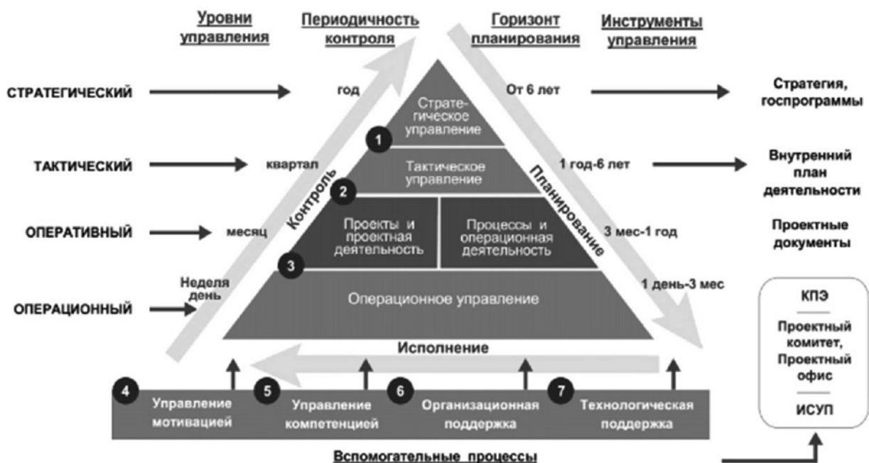
Рис. 3. Принцип «проектного треугольника»

3. Учет жизненного цикла проекта. Жизненный цикл проекта начинается с формирования самой идеи о создании проекта и заканчивается в момент истечения указанного в проекте временного периода. Жизненный цикл проекта, как правило, завершается в момент начала жизненного цикла продукта, созданного в результате реализации проекта.