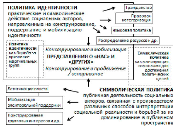
Рис. «Политика идентичности» и «символическая политика»: соотношение понятий 9