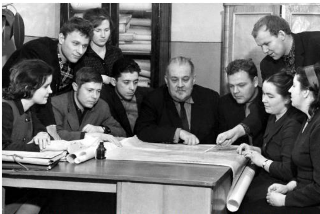
Рис. 3–12 декабря 1965 г. Лаборатория геологии научно-исследовательского сектора Пермского государственного университета. Профессор Г. А. Максимович – в центре.