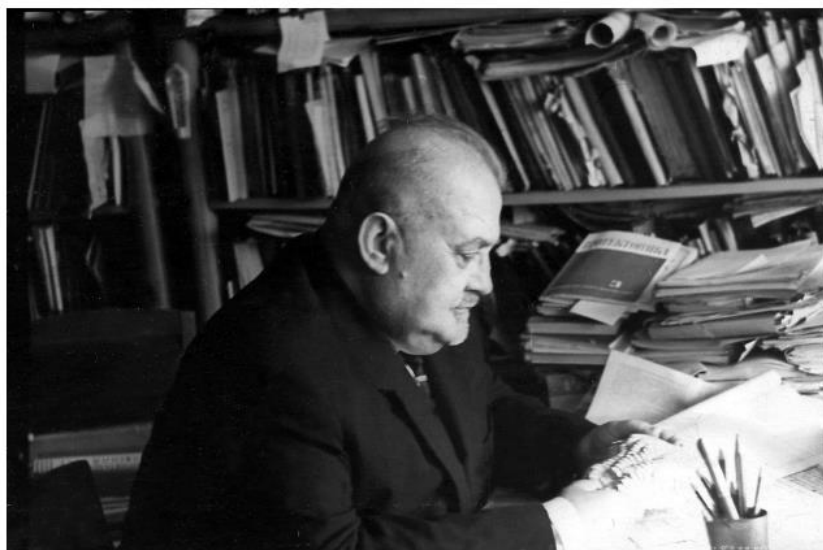
Г. А. Максимович.

Гаев, А. Я. 105 лет со дня рождения Георгия Алексеевича Максимовича (1904-1979) / А. Я. Гаев, В. Н. Катаев, И. И. Минькевич // Гидрогеология и карстоведение: межвуз. сб. науч. тр. - Пермь; Оренбург, 2009. - Вып. 18. - С. 276-278.