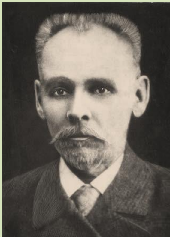
Иван Яковлевич Кривощёков (1854–1916)

Условное название: Дарственная коллекция Ивана Яковлевича Кривощёкова